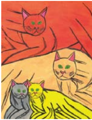
作品「猫家族」佐々木卓也さん